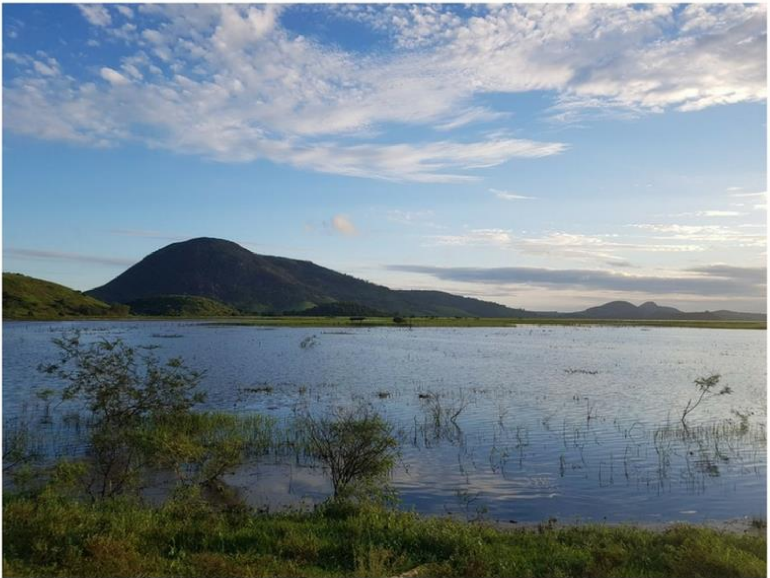
Vale do Orobó - Piúma (ES)