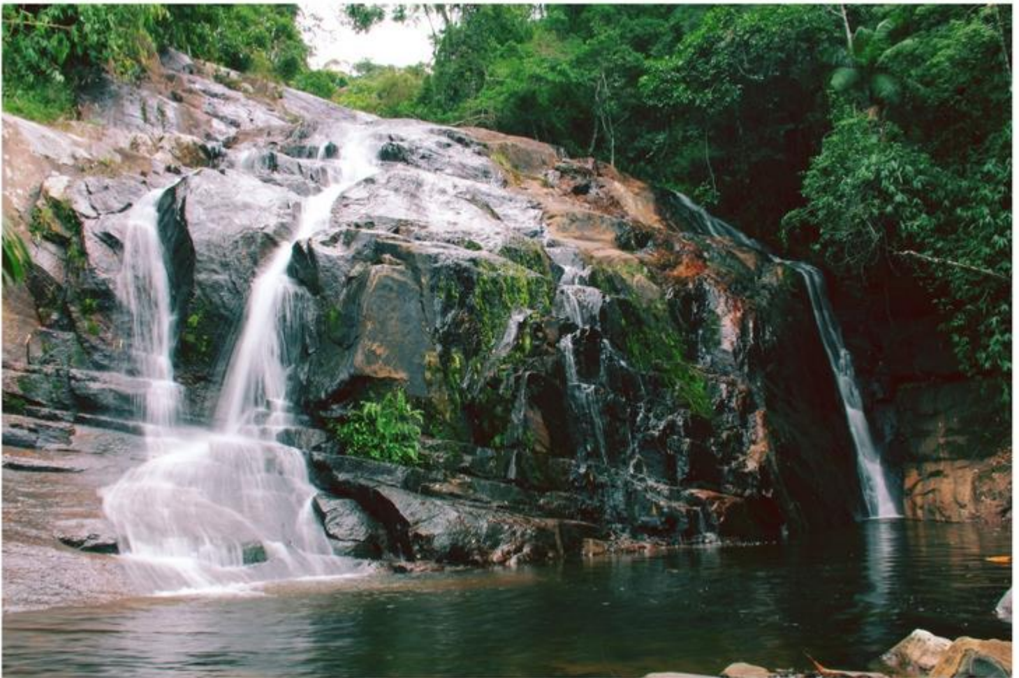
Cachoeira do Arco íris - Divino de São Lourenço (ES)