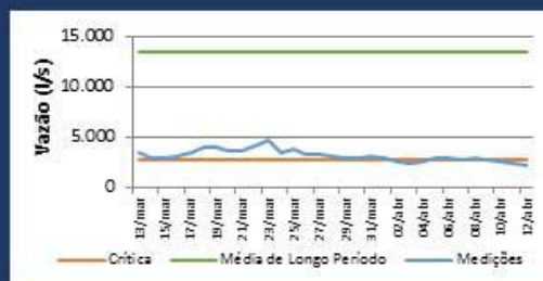
Histórico de Vazão nos últimos 30 dias