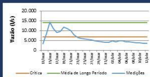
Histórico de Vazão nos últimos 30 dias