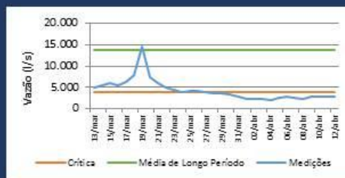
Histórico de Vazão nos últimos 30 dias