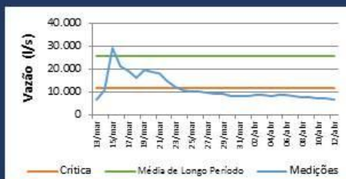
Histórico de Vazão nos últimos 30 dias