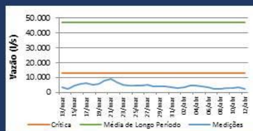
Histórico de Vazão nos últimos 30 dias