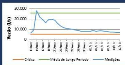
Histórico de Vazão nos últimos 30 dias